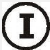
Jaime Rodríguez Calderón